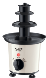
CHOCOLATE FOUNTAIN AD 4487