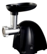
MEAT MINCER AD 4811