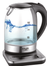
ELECTRIC KETTLE AD 1293