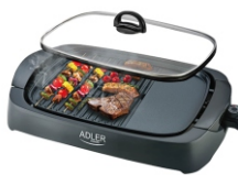
ELECTRIC GRILL AD 6610